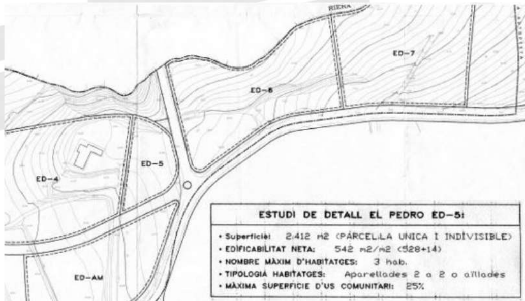
Plànol 15 "estudis de detall" del PP11