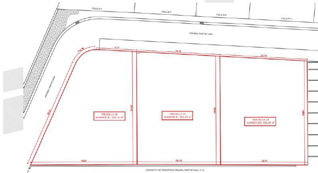
Plànol núm. 02 "Parcel·les existents"

AGRUPACIÓ: El LOT RESULTANT 1 correspon a l'agrupació de les 3 finques anteriors i el projecte presentat aporta la seva fitxa descriptiva: