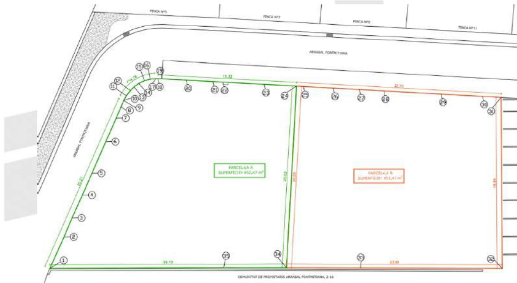
Plànol núm. 04 "Parcel·les resultants A i B"

La parcel·lació proposada compleix amb les prescripcions previstes en el planejament i amb la resta de Normativa urbanística aplicable. El planejament municipal preveu, en relació a l'àmbit on es situa el Lot Resultant 1, i pel que fa a les condicions de les parcel·les, els següents requisits: